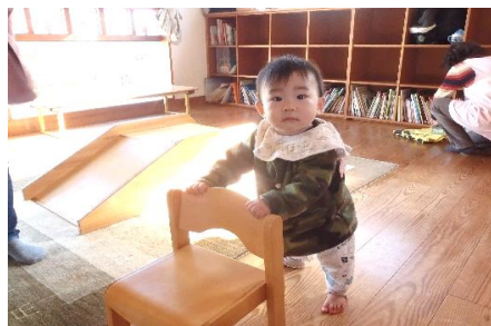
ぼく歩けるんですよ