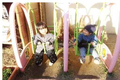
仲良しブランコ楽しいね🍒