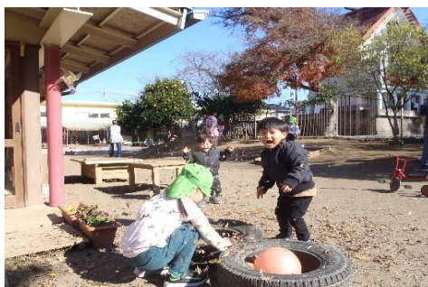
落ち葉のシャワー最高!