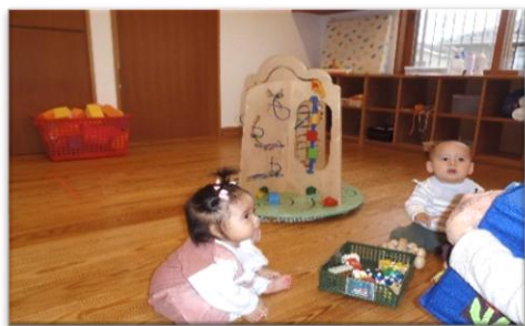
♪～優しい歌声だなあ