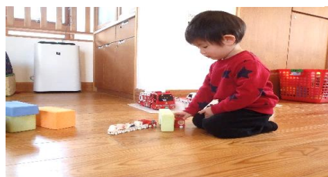
そ～っとそ～っとトンネル通るよ