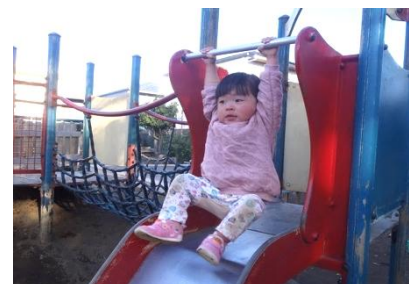
こんなこともできるよ!