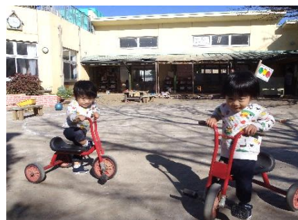
ほら、三輪車乗れるよ!