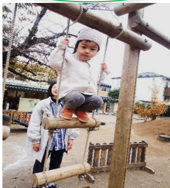
高くても平気だよ。ママがいるしね